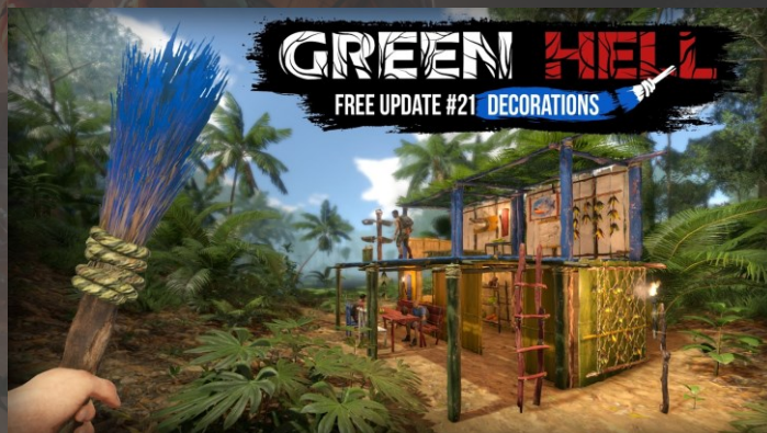
#21 Decorations PC premiera 03.09.2024 r.