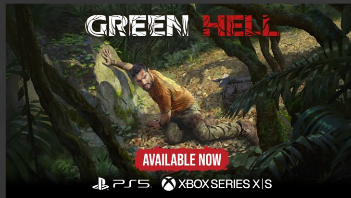
Green Hell PlayStation 5 i Xbox Series X|S premiera 14.08.2024 r.